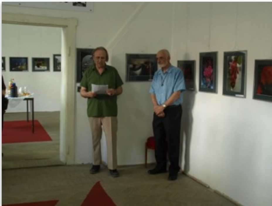
A kiállítás megnyitóján